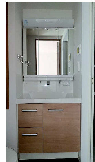
シャワー付洗面化粧台 三面鏡収納付き