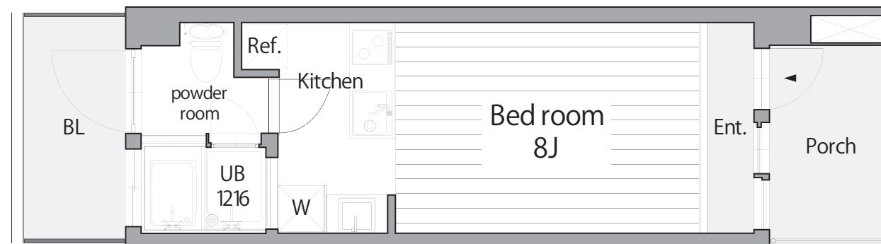
図面と現況が異なる場合は現況を優先します。

DESIGNER'S MANSION 402 1R 23.82 m 2 ¥ 82,000